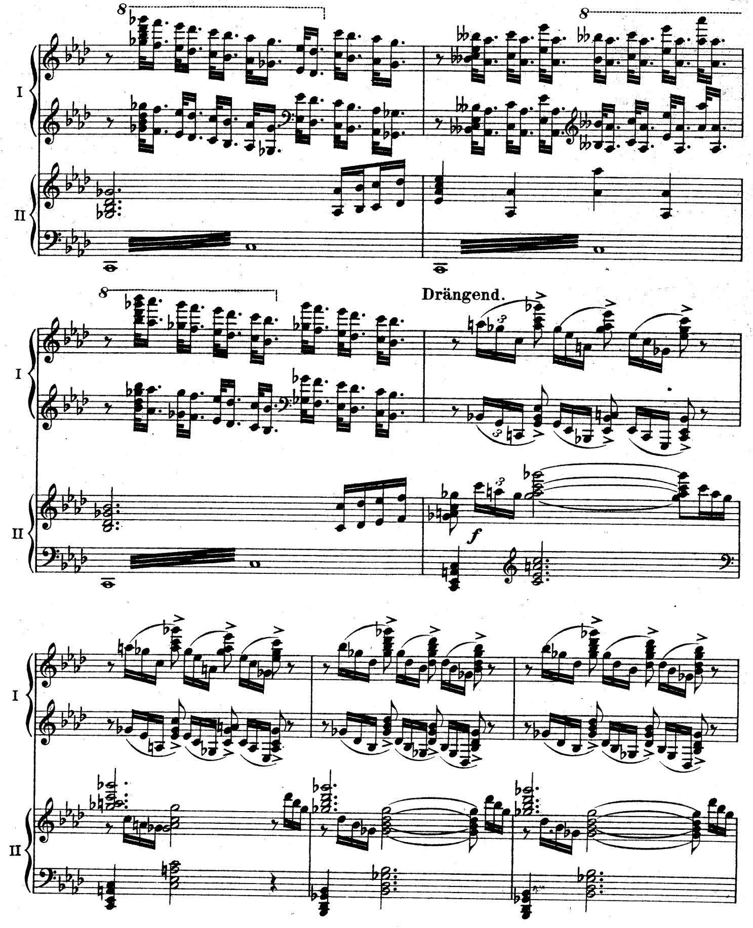
F. E. C. L. 6878