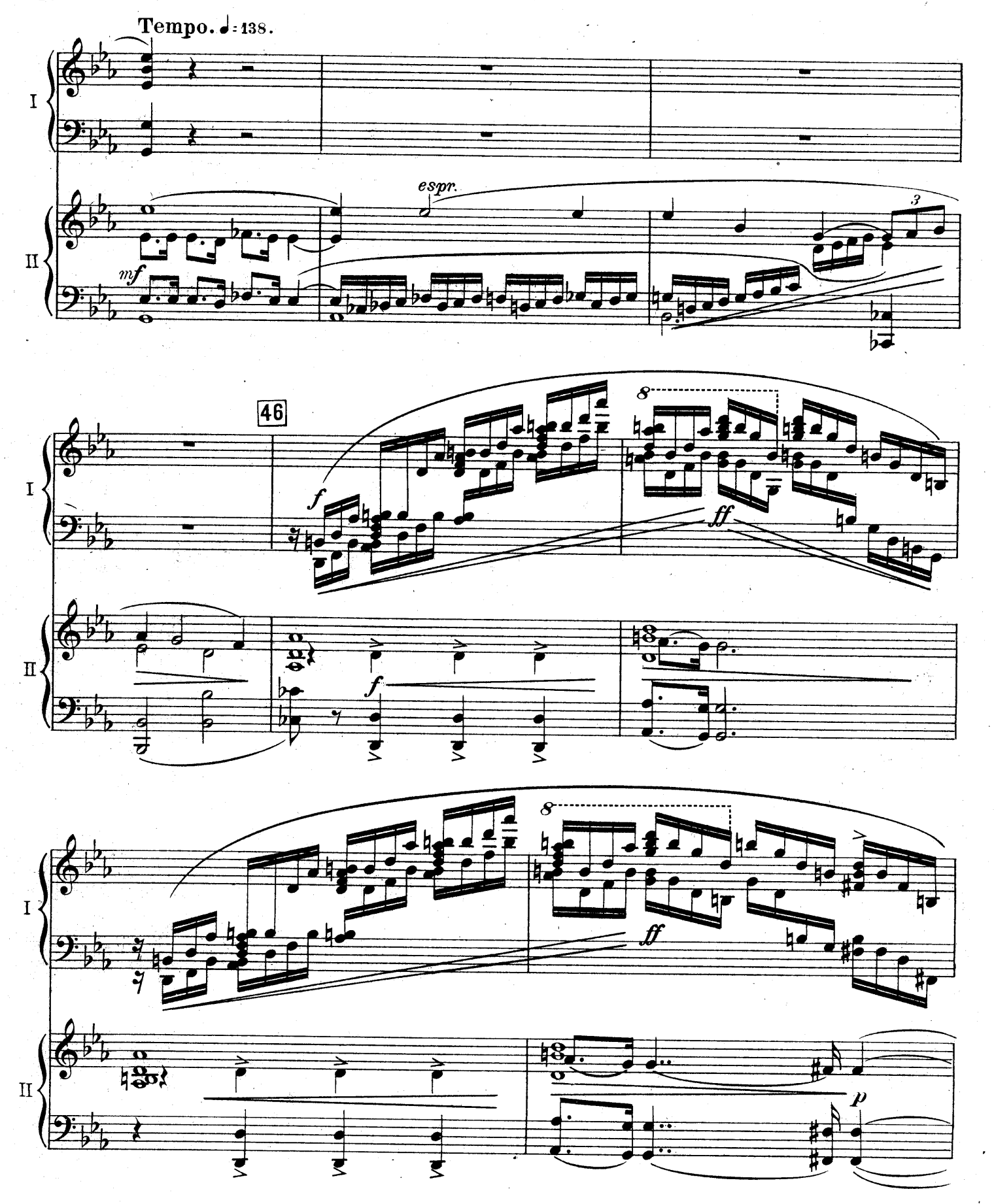
F. E. C. L. 6878