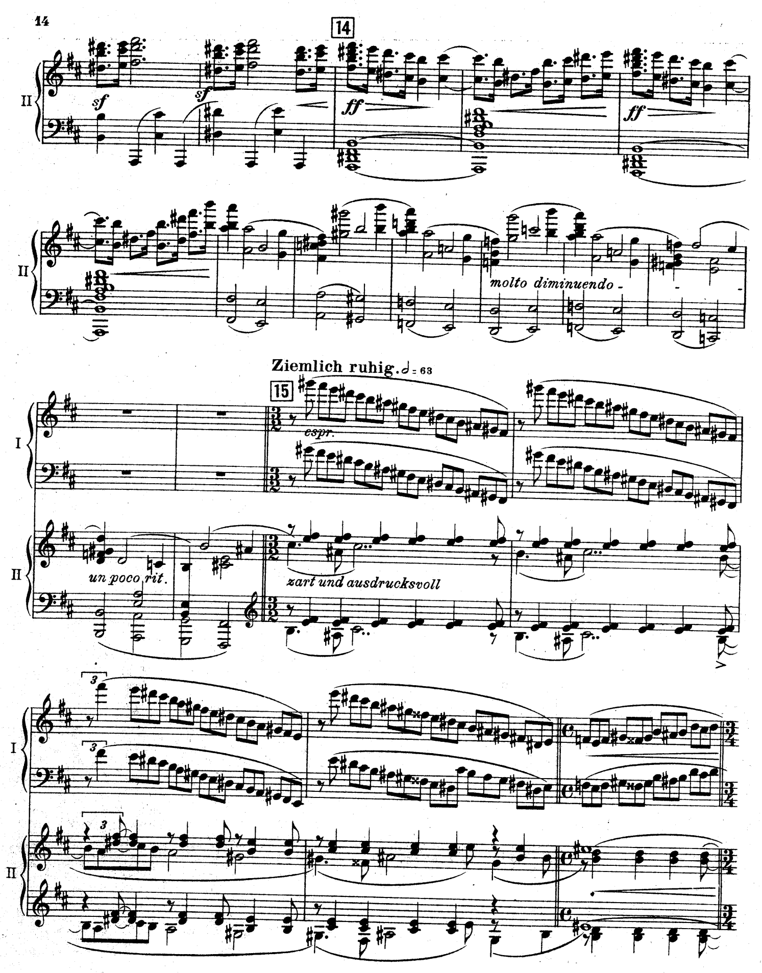
F. E.C.L. 6878