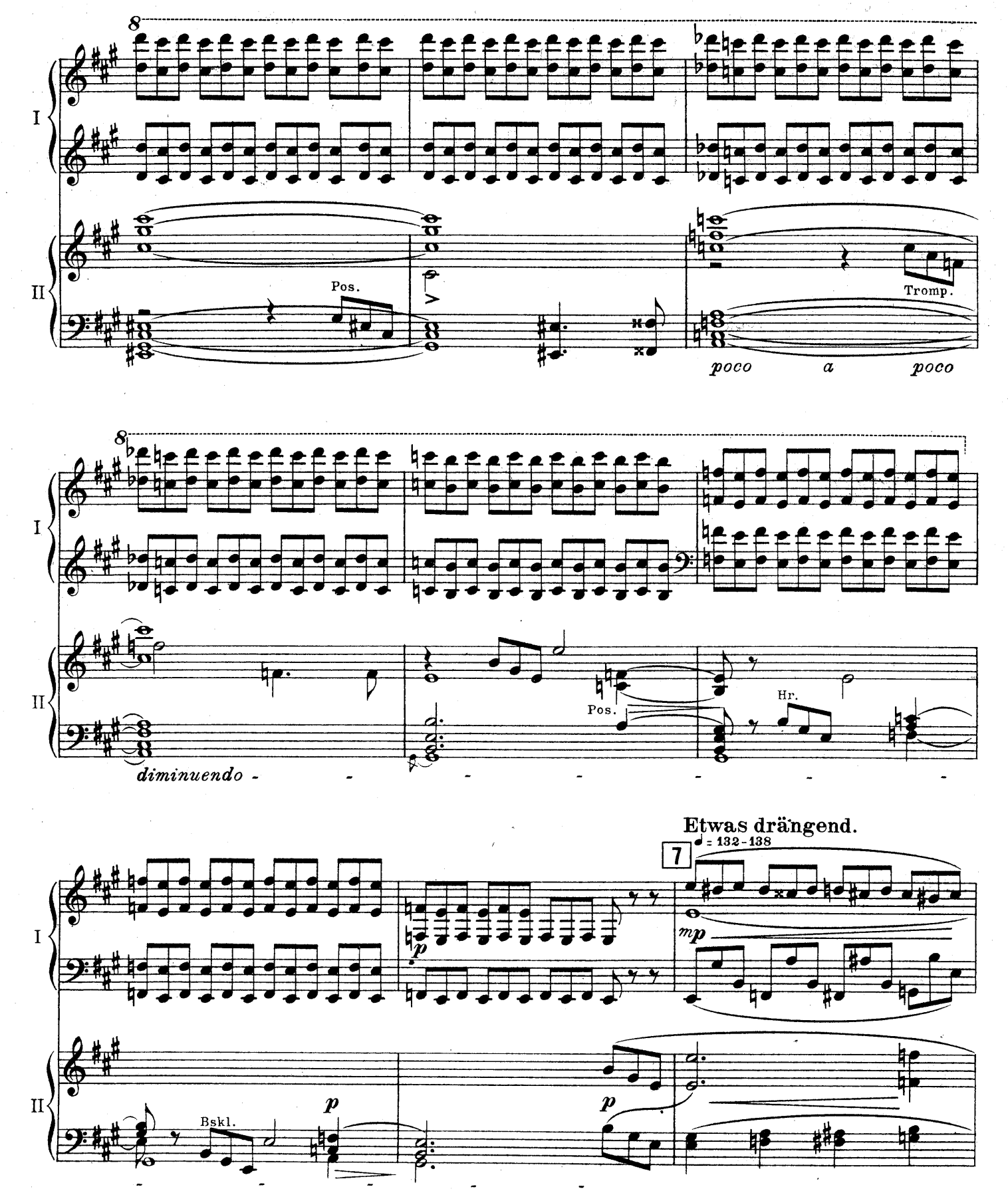
F. E. C. L. 6878