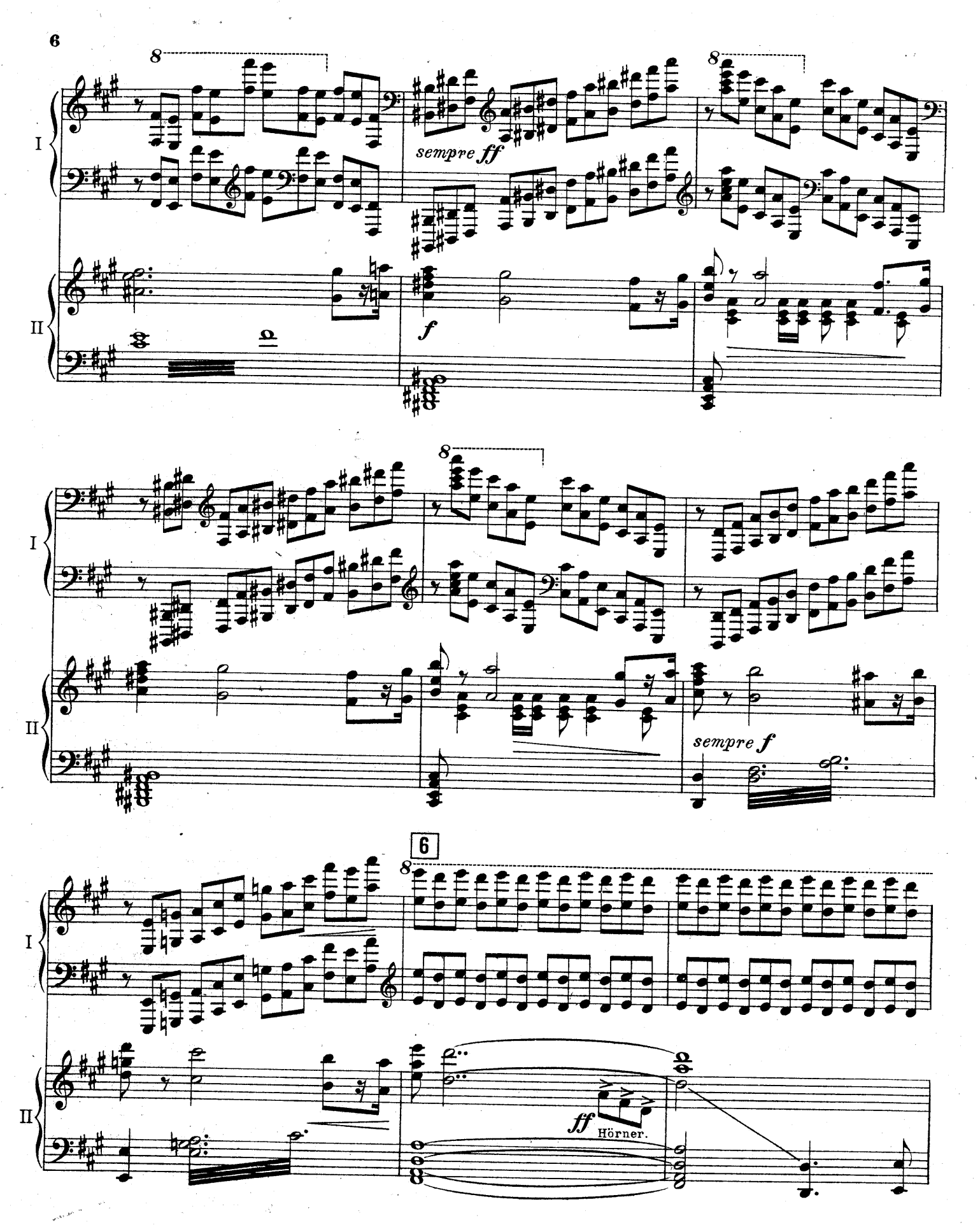
F. E.C. L. 6878