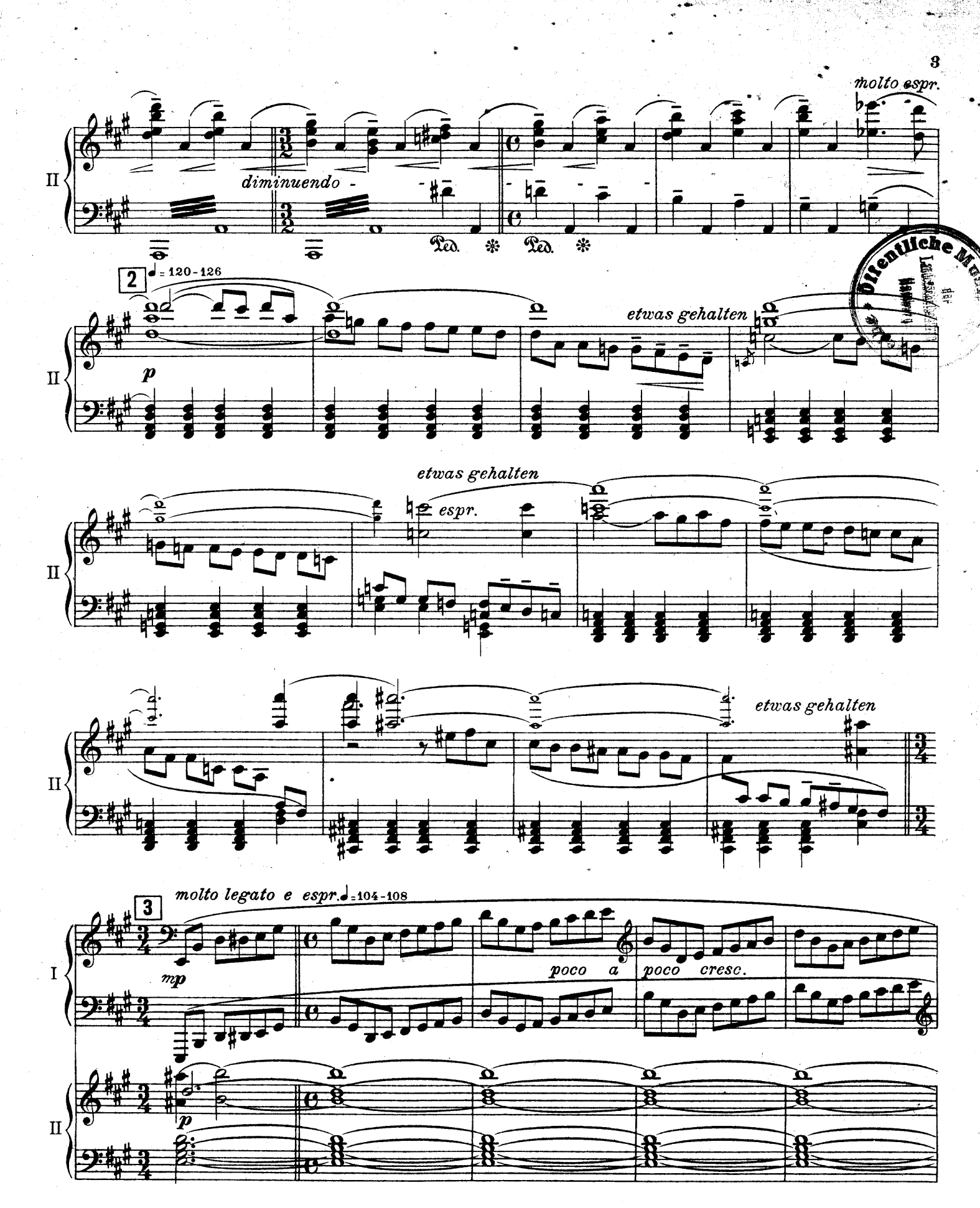
F. E. C. L. 6878