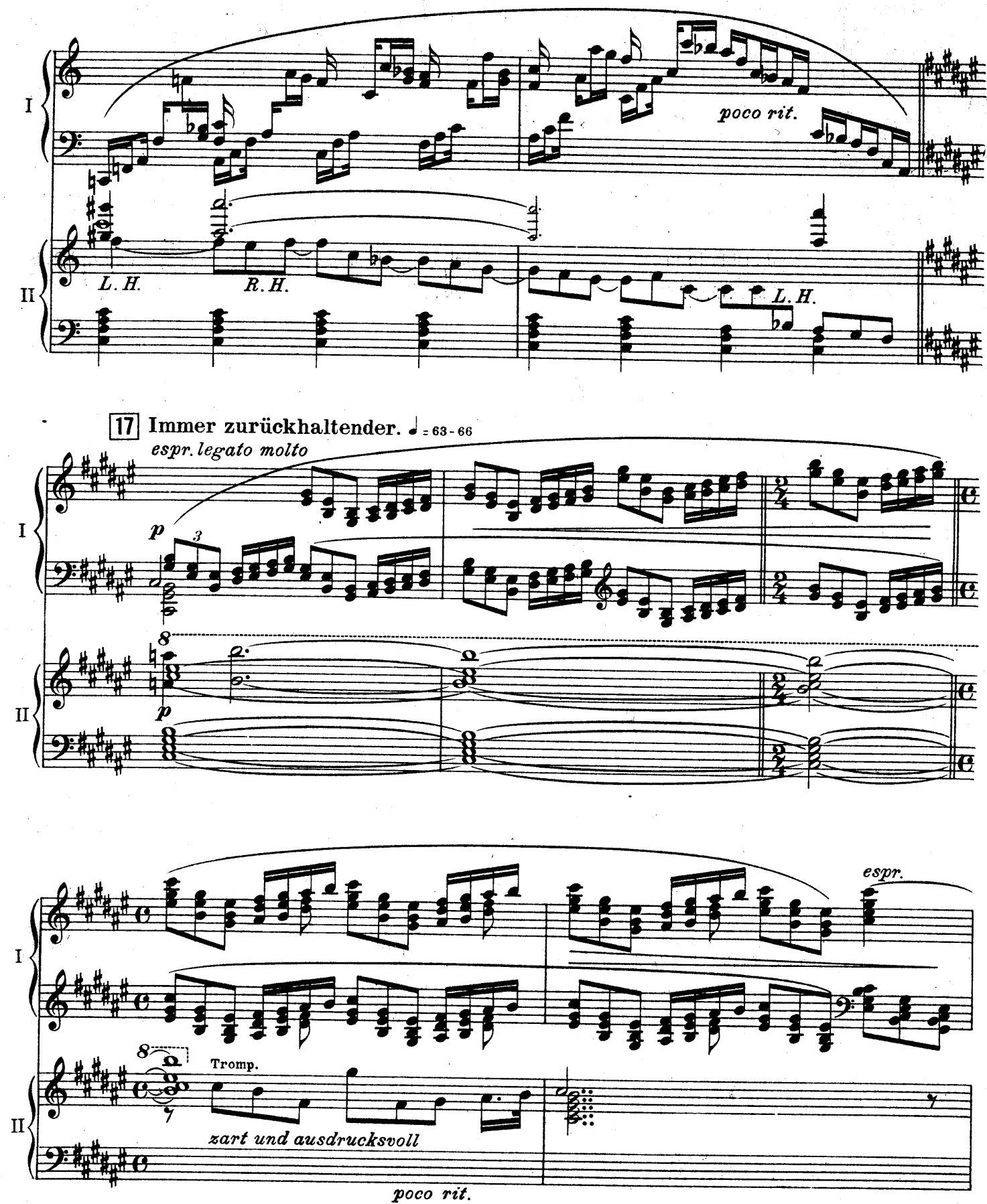
F. E. C. L. 6878