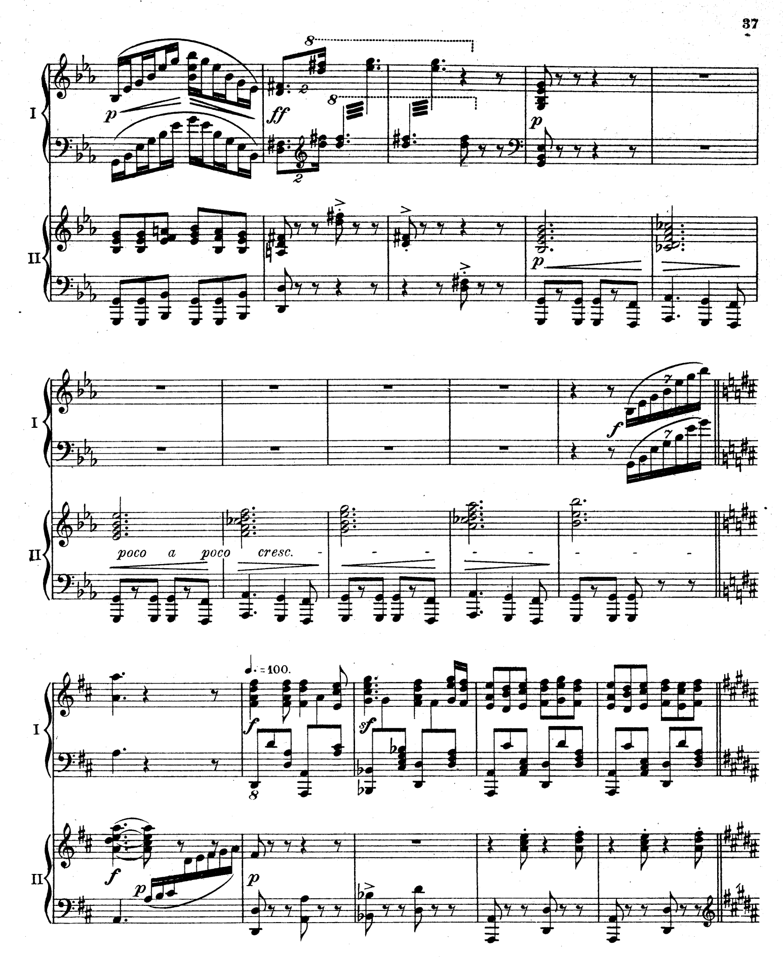
F. E. C. L. 6878