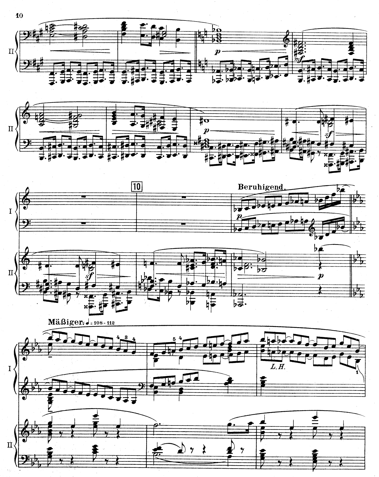
F. E.C. L. 6878