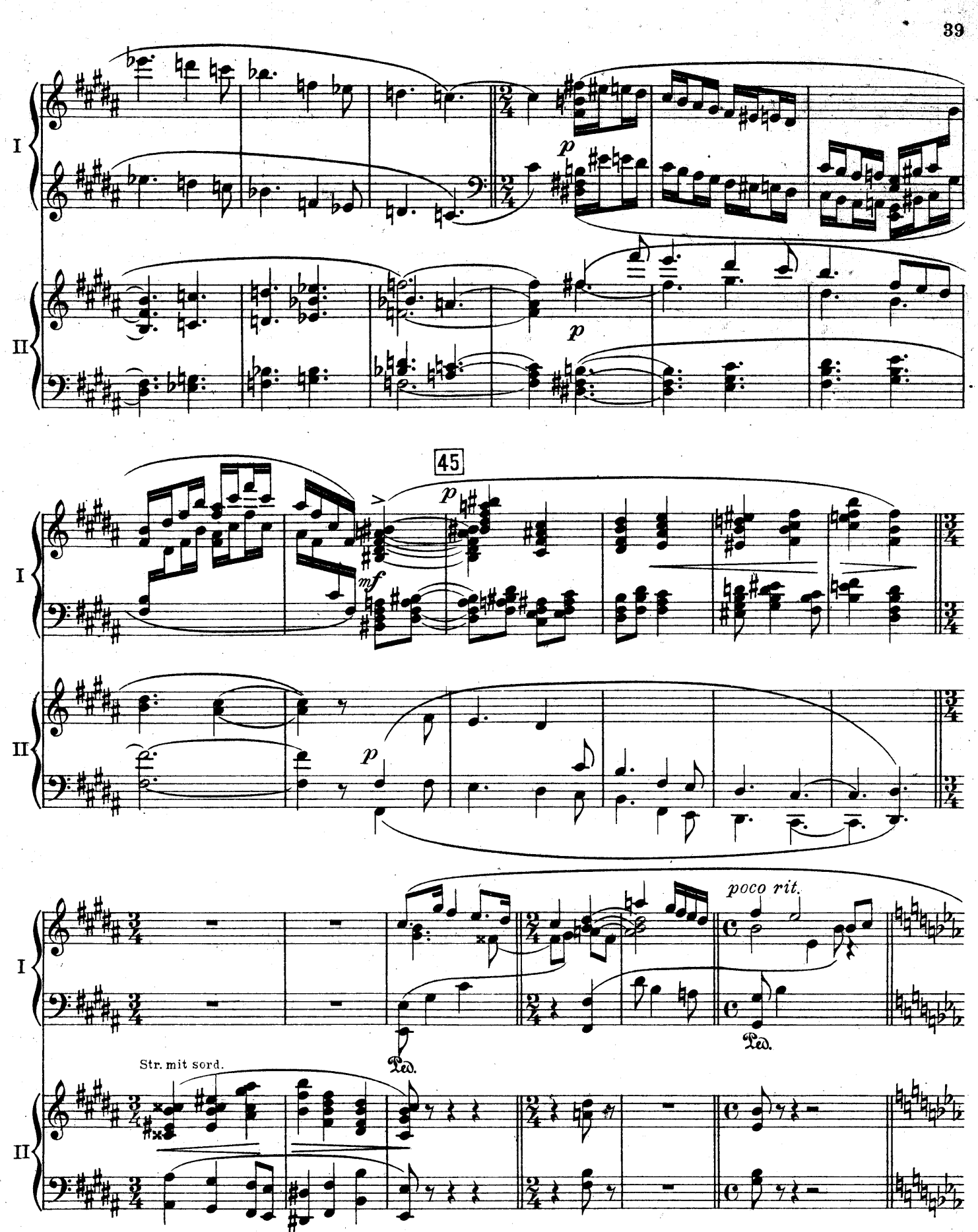
F. E. C. L. 6878