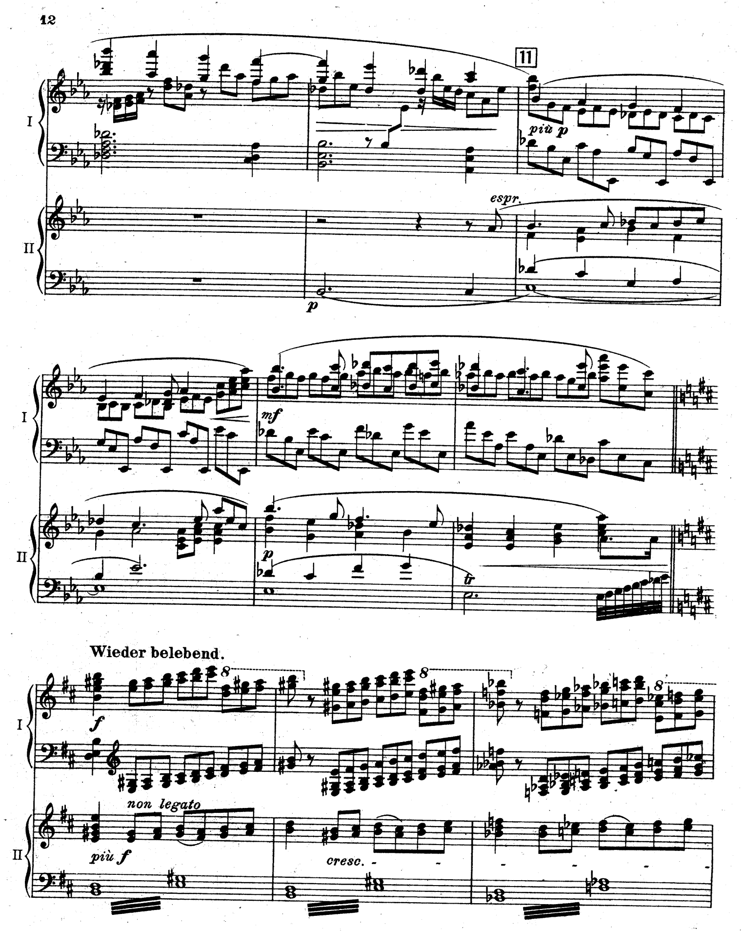
F. E. C. L. 6878