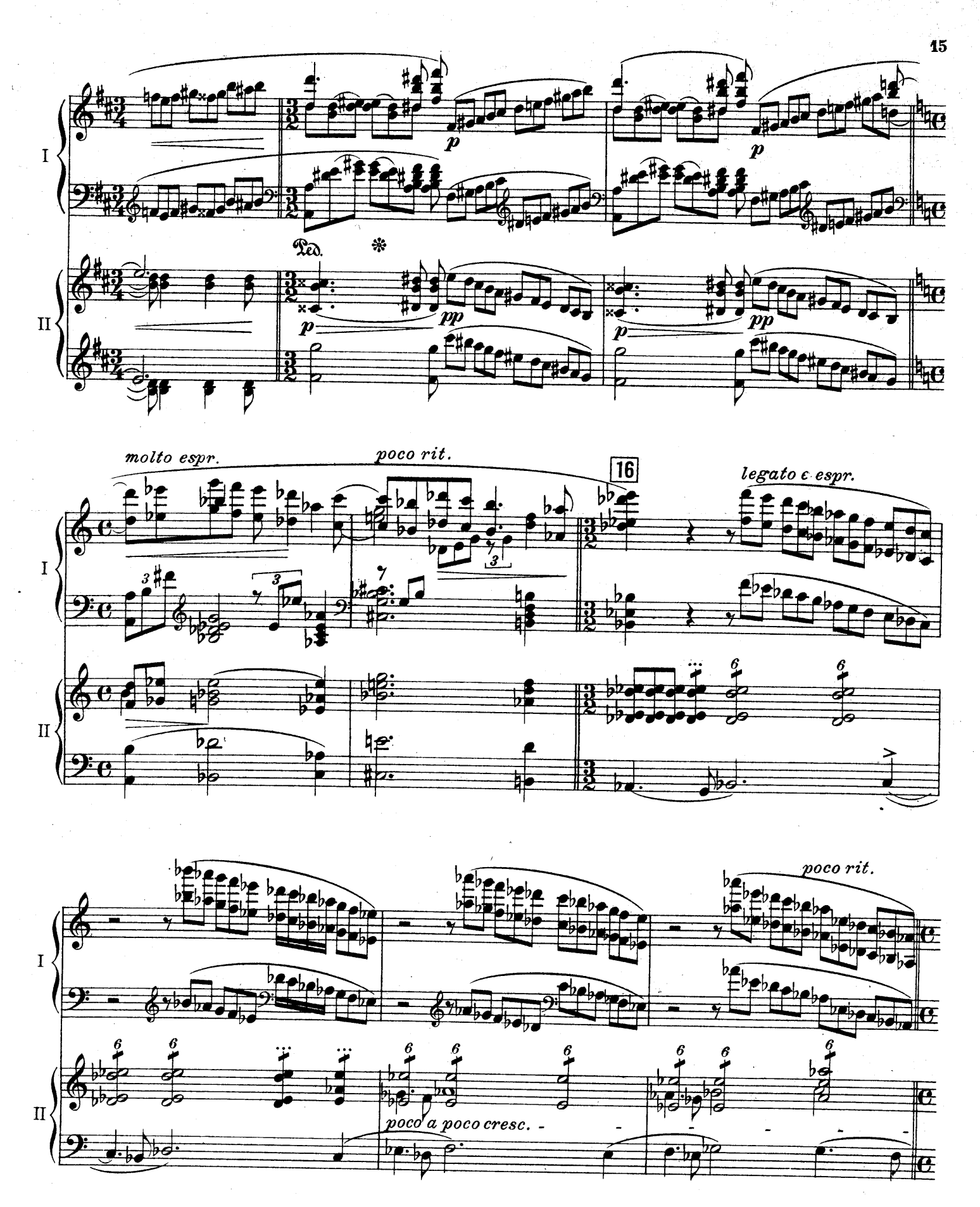
F. E.C. L. 6878