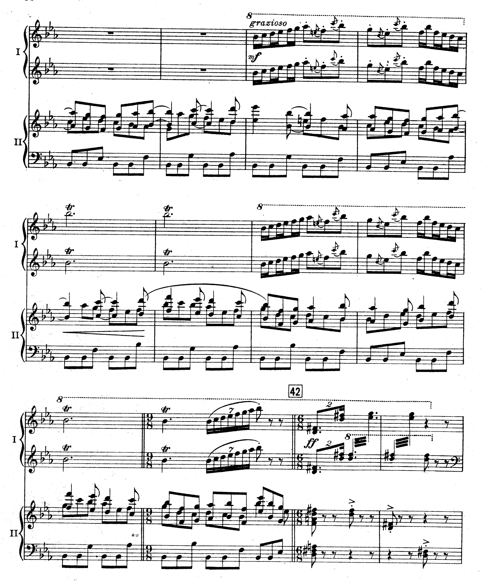
F. E. C. L. 6878