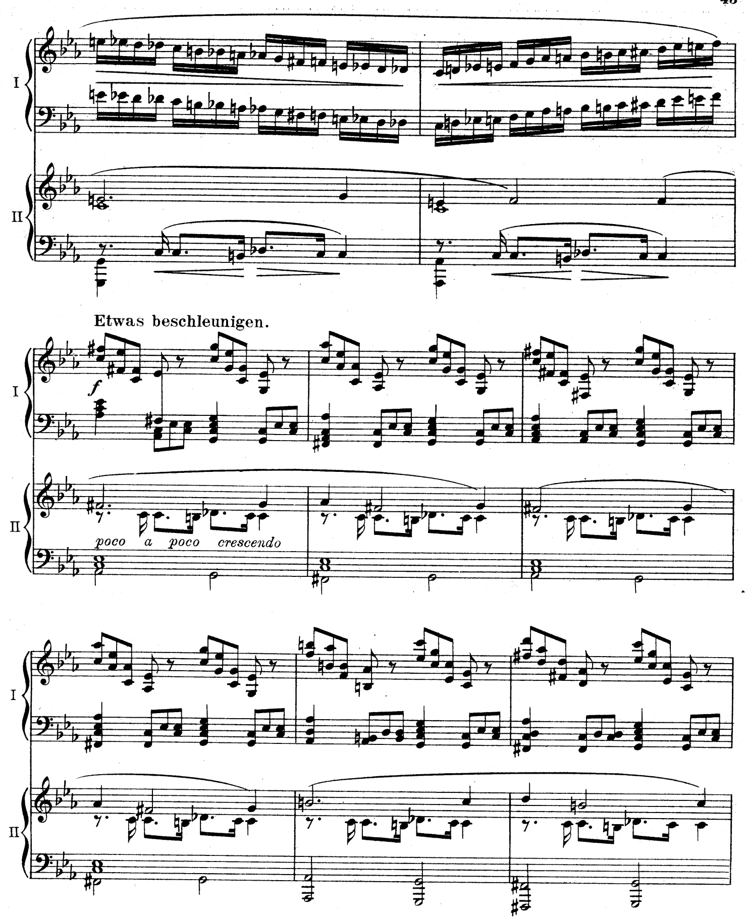
F. E. C. L. 6878