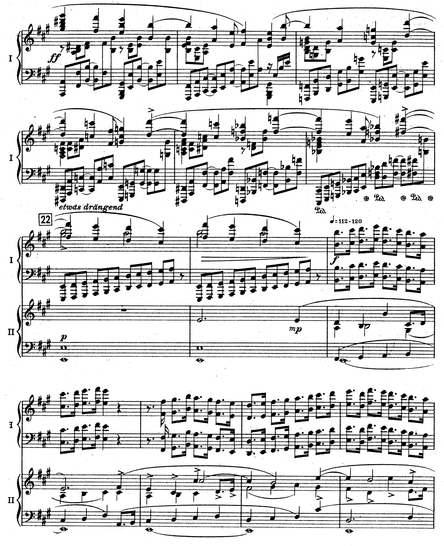
F. E.C. L. 6878