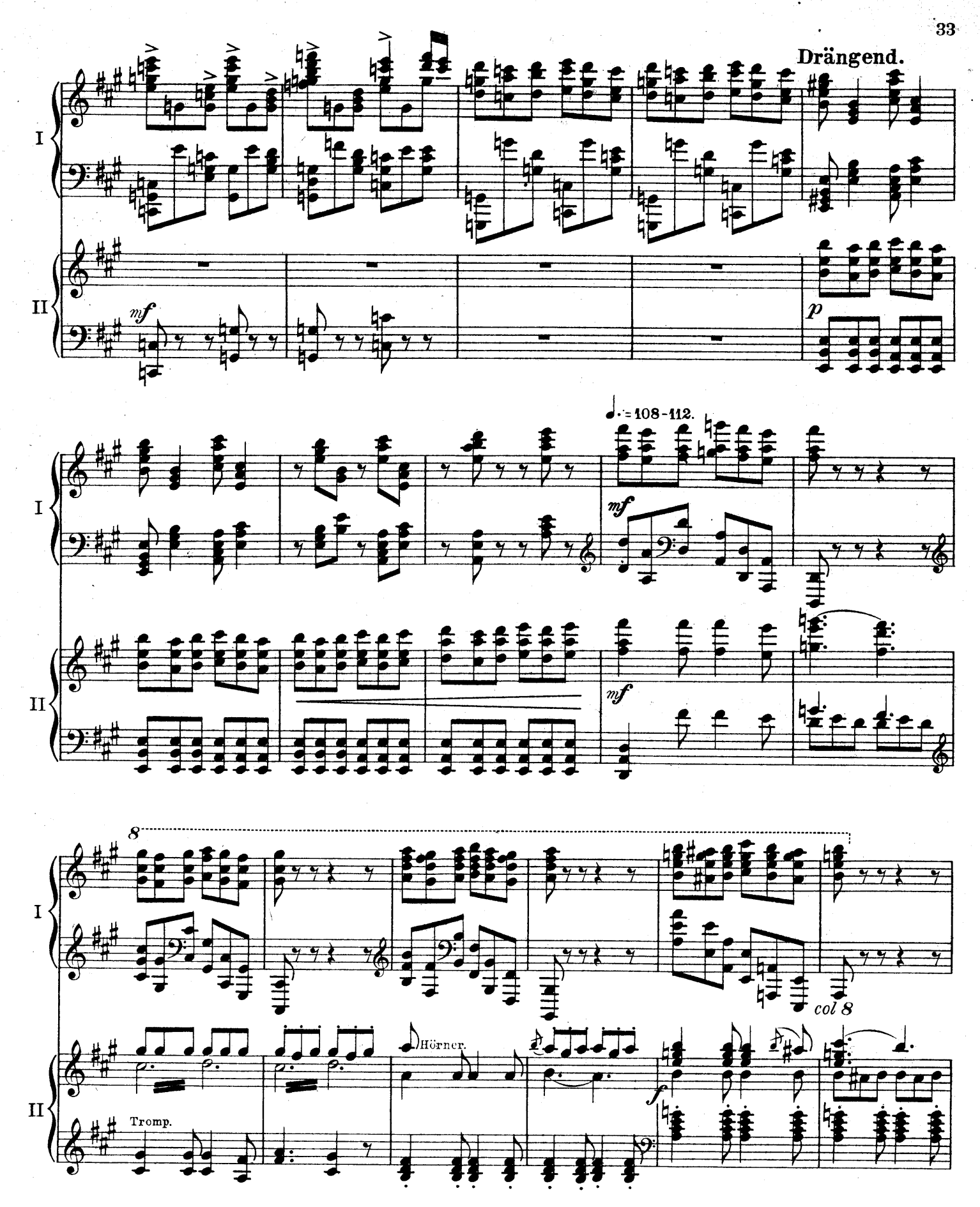
F. E. C. L. 6878