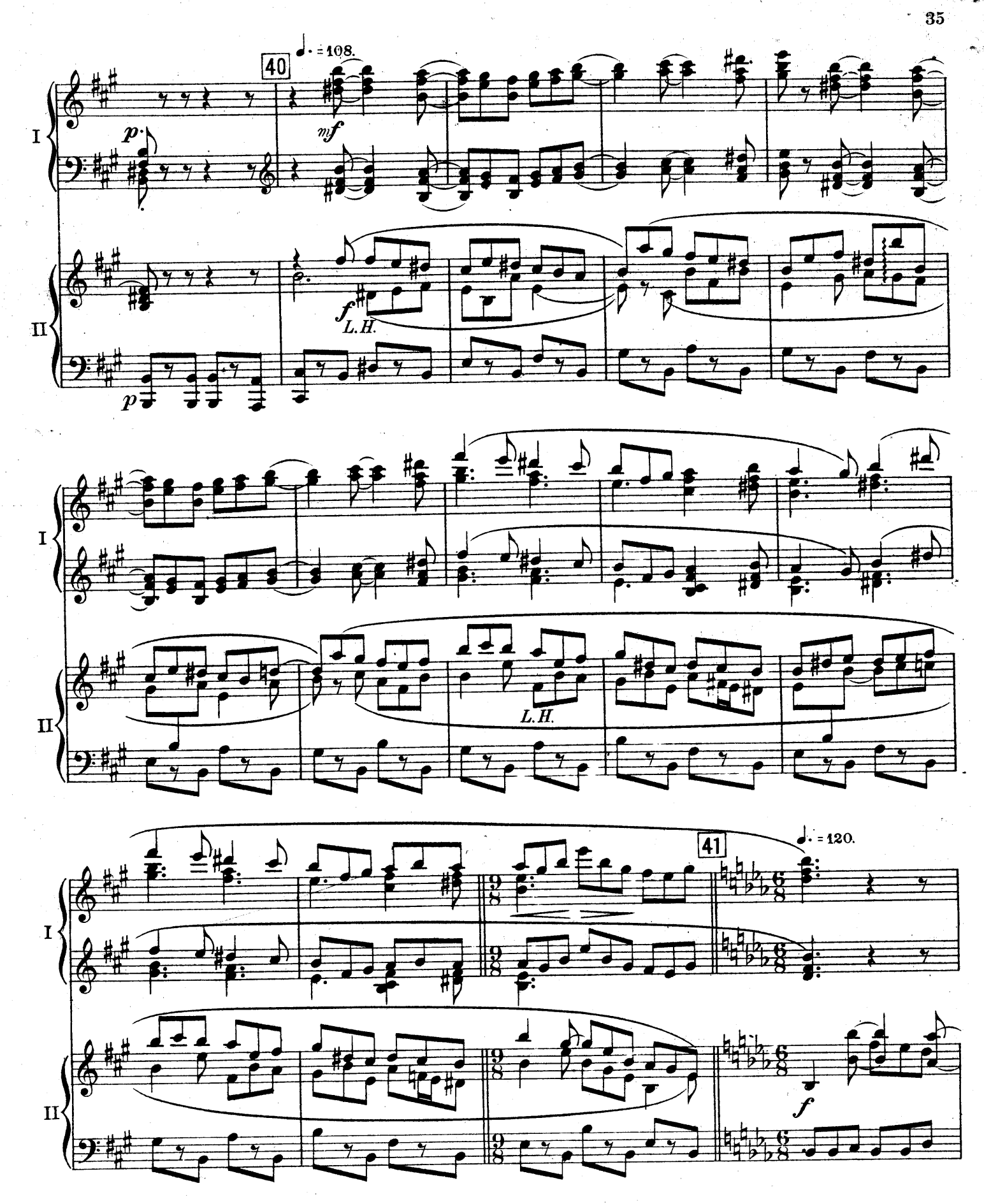
F. E.C. L. 6878