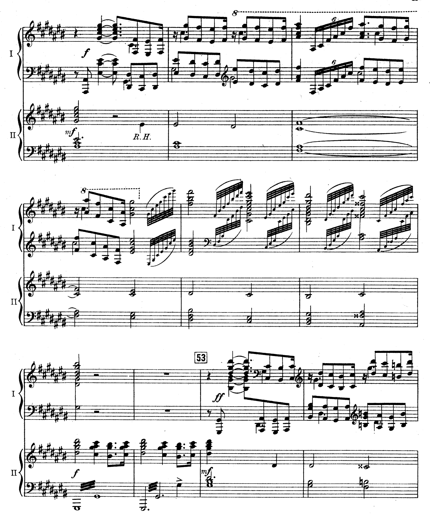
F. E. C. L. 6878