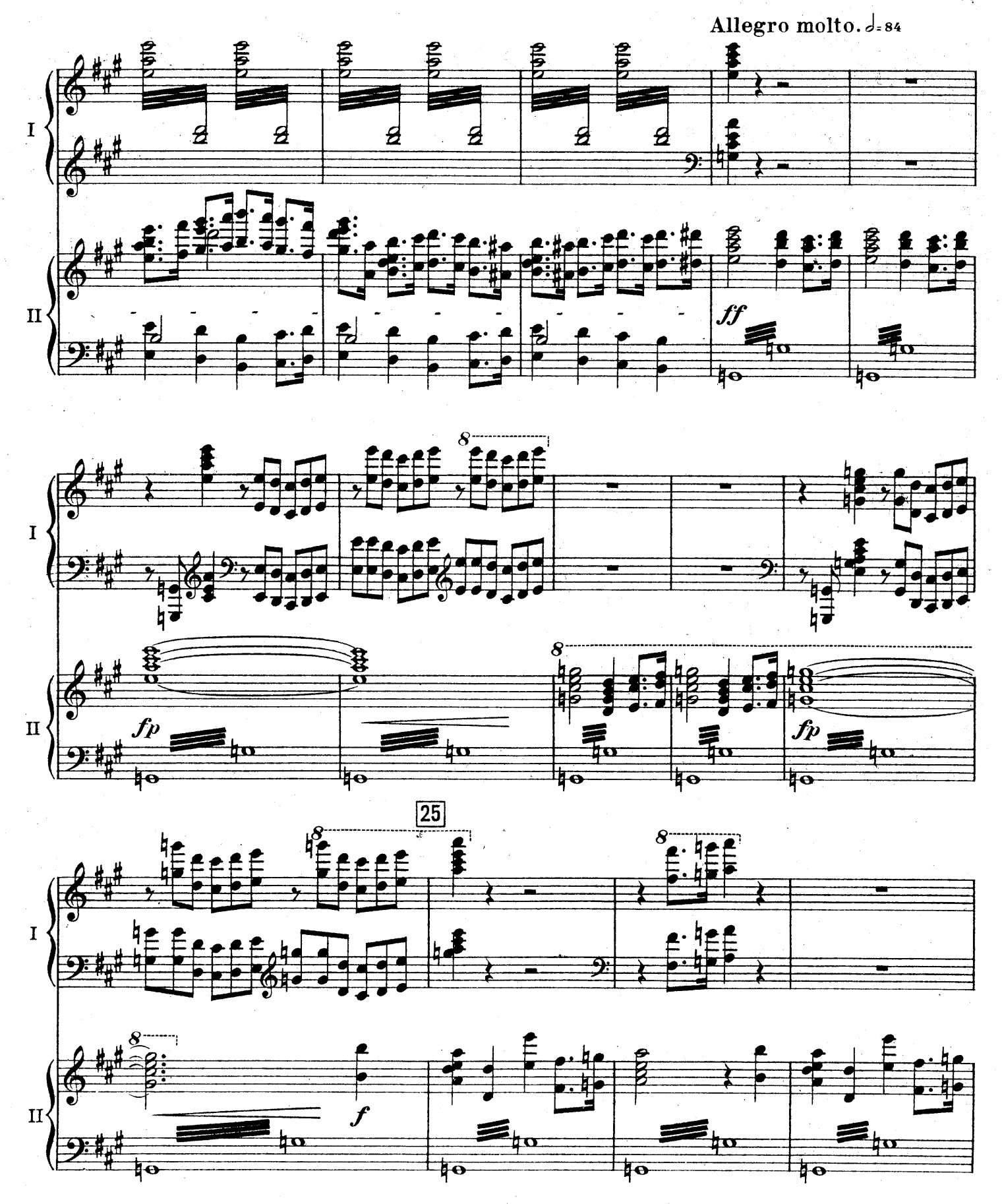
F. E. C. L. 6878