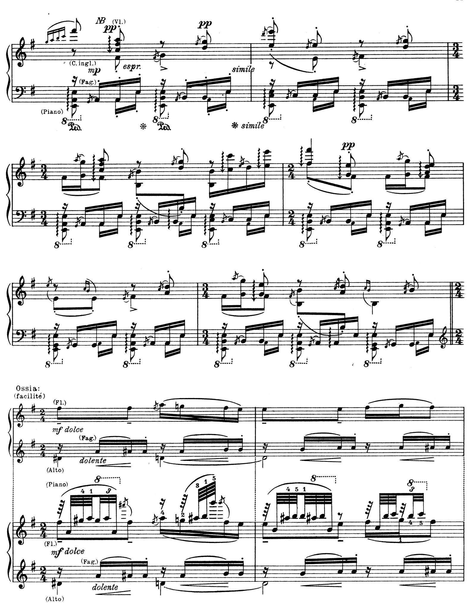
B de l'arpège de haut en bas.