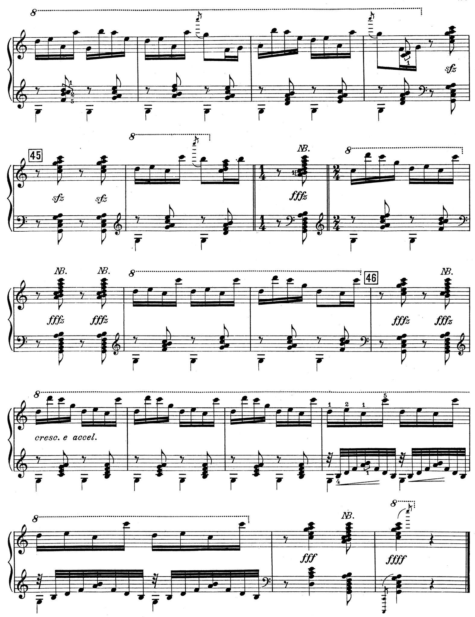
W. Mit ganz ausgestreckten Fingern und flachen Händen sind diese Akkorde weniger anzuschlagen als "anzudrücken" A toucher avec des mains plates et avec des doigts complétement allongés